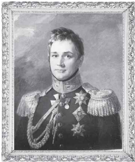
Воронцов Михаил Семёнович (1782 - 1856) Русский военный и государственный деятель. Генерал-губернатор Новороссийского края (1823-1854).

В XIX веке эпиграммы писали на всех: друг на друга, на царей, балерин и архимандритов. Но по какой-то иронии судьбы хлесткое пушкинское четверостишие — сам Александр Сергеевич впоследствии не рад был, что написал его, — сыграло злую шутку с человеком, который менее других был этого достоин.