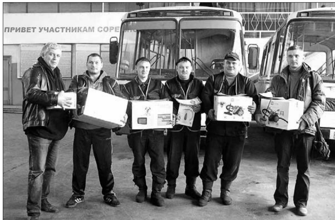
Призеры конкурса получили заслуженные награды.

Вполне устраивает работа. Встречаются разные пассажиры, бывают и недовольные, а добродушные благодарят нас, привыкая делиться своими радостями и проблемами, - кондуктор не скрывает своих отношений с пассажирами. - Когда долго работаю на одном маршруте, мы привыкаем к людям, даже знаем, где кому выходить. А ещё хотел заступиться за наших водителей, которые выходят на пенсию в 60 лет. Городские водители, условия работы которых несравненно лучше, отправляются на за-