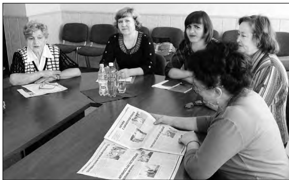
Профактив областной организации.

Скромные работники потребкооперации особыми подвигами не прославились. Но отличаются бескорыстным трудом во благо своих земляков. Мне доводилось рассказывать, как на севере области в трескучие зимние морозы, когда птицы замерзали на лету и не заводились машины, пекари доставляли в магазины укутанный горячий хлеб в саночках. А во время весеннего половодья в лодках завозили продукты питания в сёла, отрезанные от «большой земли» рекой Иртыш или его притоками. Бывает, что на автолавках выполняют заказы жителей малонаселённых пунктов за полста и более километров, доставляют выпечку не только в свои, но и в соседние районы. После таких перегрузок необходим полноценный отдых, что и осознают в профсоюзной организации. Ежегодно более 50 работников отрасли и члены их