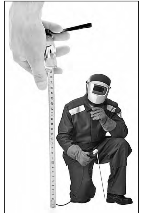
СРАВНИТЕЛЬНАЯ ТАБЛИЦА ПРОЦЕССА РАЗРАБОТКИ ПРОФСТАНДАРТОВ И ХАРАКТЕРИСТИК ЕТКС И ЕКС

Трудовая функция состоит из описания трудовых действий, а также умений и знаний, которые необходимы работнику для ее выполнения.