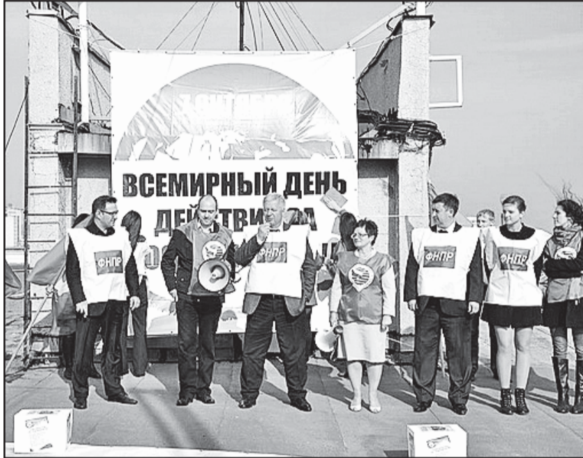
Хабаровск. В митинге принял участие председатель ФНПР Михаил Шмаков.

В Иркутске 7 октября прошел митинг у здания правительства области. В акции, организованной областным профобъединением, приняли участие более 300 человек, предста-