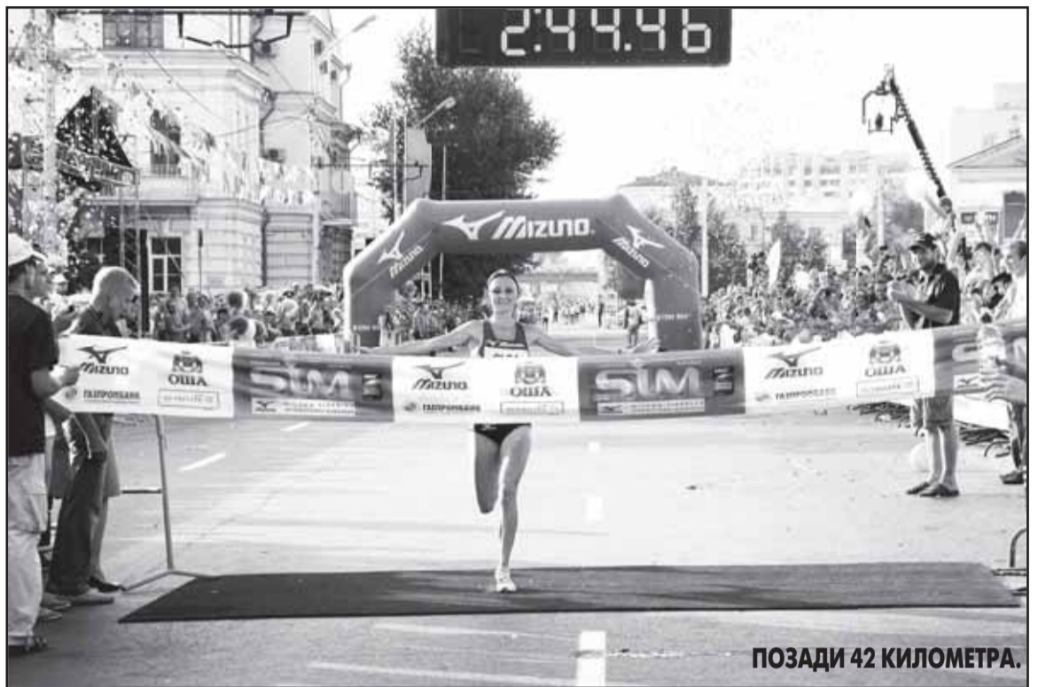
ПОЗАДИ 42 КИЛОМЕТРА.