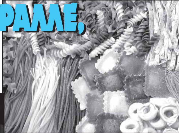
Букатини — соломка из элитных сортов пшеницы, каваталпи — макароны в виде широкого завитка с полостью внутри, фарфалле, или бабочки, могут быть цветными, равиоли — родственники наших пельменей.

ингредиенты, что и для соусов: мясо, рыба, сыры, зелень, овощи. Некоторые разновидности готовятся очень быстро: раскатывается пласт теста, кладутся маленькие горки начинки, сверху — еще один пласт теста, после чего нарезаются квадратики специальным ножом с зубчатым колесиком. Так делают, например, «аньоветти». А для «карамелле» тесто сначала нарезают квадратами, кладут начинку и заворачивают, как конфетные фантики. Еще причудливее закручивают «фаготтини» — узелки.