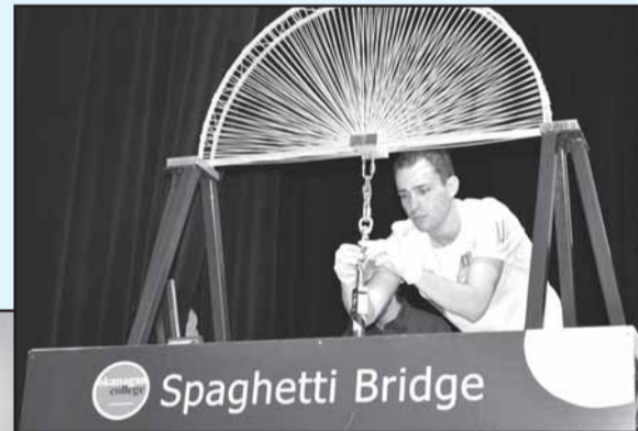
В любом случае навыки, полученные при строительстве мостов из спагетти, применяются молодыми инженерами в реальном проектировании. С 2004 года принимать участие в соревнованиях могут только студенты или аспиранты.