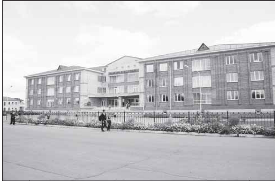
Гордость Павлоградки - свежестроенная гимназия, коих и в областном центре мало.

съезд Советов» из Урожайки, «Кооператив» из Мечётовки, «Пятилетка в четыре года» (Граждановка) и имени Шевченко, что находился в Новокупянке. Самым крупным из них был последний, но не ему суждено было стать центральной усадьбой «Красного знамени». Она расположилась в Милоградовке, потому что именно сюда пришелся географический центр нового огромного образования.