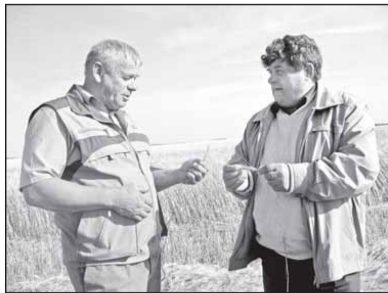
Короткая беседа в разгар страды.

- Уборка организована не хуже прошлых, - говорит он. - И