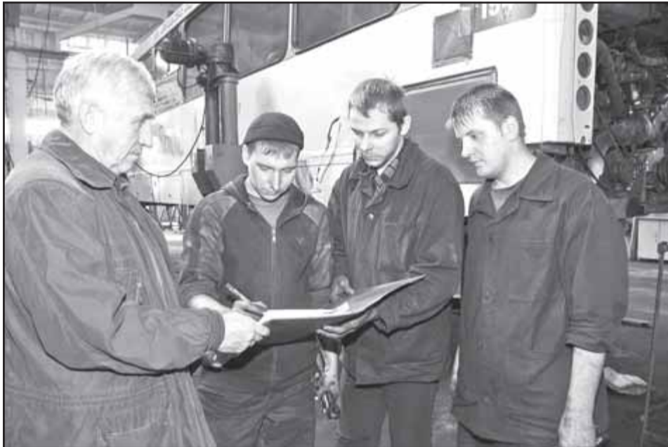
На автопредприятиях идет сбор подписей.

И о качестве бензина, дизтоплива тоже следует побеспокоиться. Как-то так сложилось, что на него обращается, пожалуй, меньше всего внимания. Отъезжаем от автозаправки и чувствуем: что-то машина "не тянет". Ну и ладно, лишь бы доехать куда надо. А ведь помимо, так сказать, технической это еще и серьезнейшая экологическая проблема. Еще одна для далекой от чистоты воздушной среды в Омске.