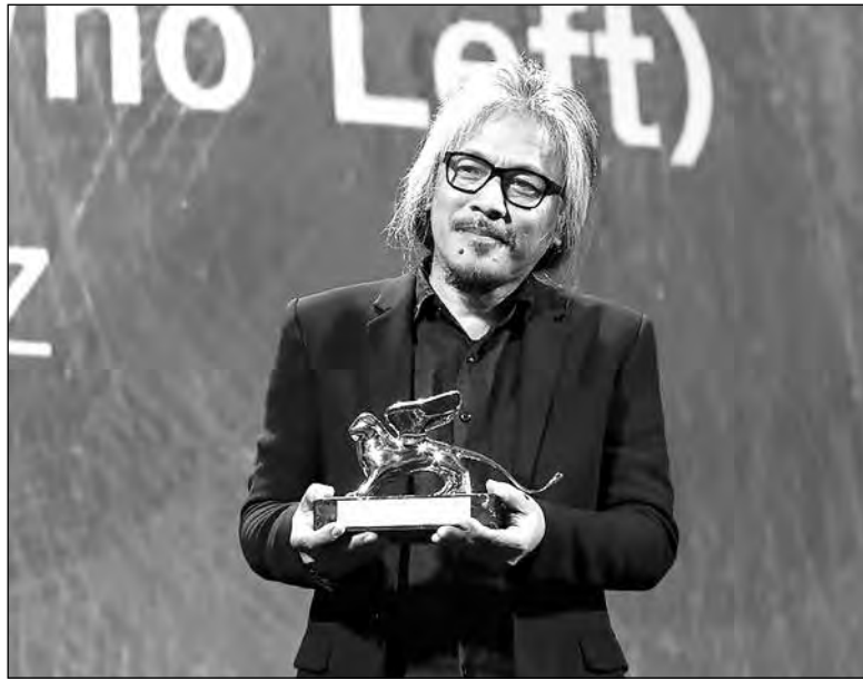
Главный приз фестиваля присужден Лаву Диасу за драму "Женщина, которая ушла".

Серебряного льва за лучшую режиссуру получил Андрей Кончаловский за фильм "Рай", главную женскую роль в котором сыграла его жена Юлия Высоцкая.