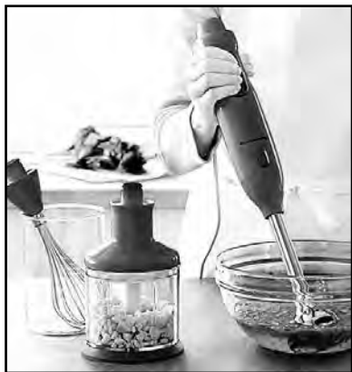
Слово миксер происходит от английского глагола to mix - смешивать. А английское to blend означает изготовлять смесь или сочетать.

Блендер - более легкий и компактный прибор. Он тоже может взбивать жидкие смеси, но только с помощью одного венчика. К тому же такая насадка есть далеко не у всех моделей. А вот тестомесильных крюков у блендеров нет вообще.