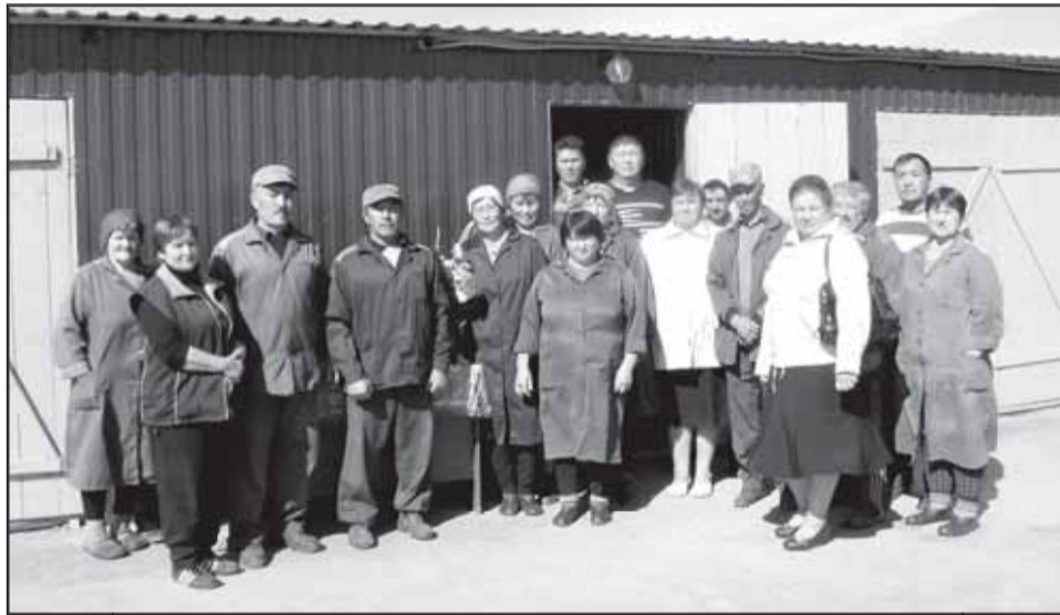
Коллектив молочно-товарной фермы «Комиссаровская».

Кстати, что касается животноводства, то в минувший летний период в этой отрасли у шербакульцев произошло много важных событий, первым из которых стало открытие животноводческого комплекса с доильным залом на тысячу коров в ЗАО «Кутузовское». В честь этого мероприятия на базе комплекса состоялось заседание «Клуба 100» - объединения самых крупных и прибыльных хозяйств области, участие в котором приняли специалисты регионального Министерства сельского хозяйства и продовольствия, руководители сельскохозяйственных предприятий, главы муниципальных районов. Вел заседание министр сельского хозяйства и