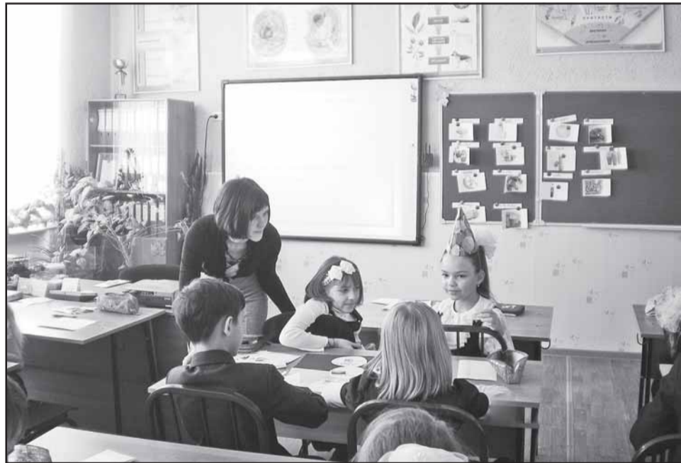
Практически все молодые специалисты, пришедшие в учреждения образования округа в прошлом учебном году, и сегодня продолжают в них трудиться.