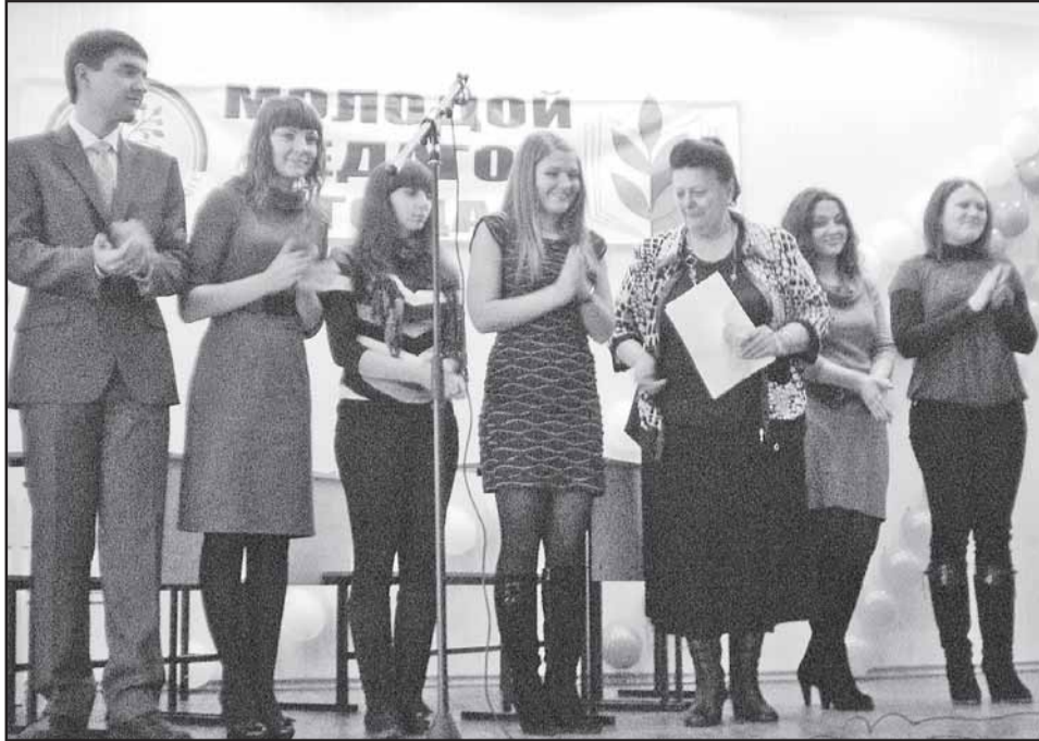
Участие в конкурсе профмастерства, организованном райкомом и молодежным советом, помогло молодым педагогам обрести уверенность в своих силах.

- Насколько я знаю, на тот момент это были единственные в городе подобные со-