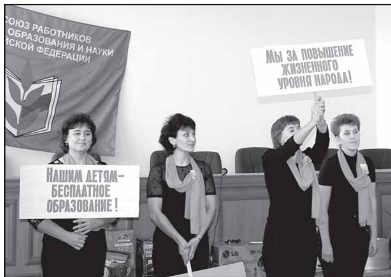
Конкурс агитбригад по мотивации профчленства уже стал традицией просвещенцев. Запланирован он и на этот год.

других районах - всего на 10. Стабильной остается численность в Колосовской, Оконешниковской, Саргатской, Черлакской, Шербакульской районных организациях. Что касается численности членов профсоюза, то тут также есть потери. Вновь проиллюстрируем ситуацию цифрами: охват профчленством в настоящее время составляет 76 процентов. В Омской области на 1 января 2012 года в нашей сфере насчитывалось 79549 работающих и студентов, из них членов профсоюза 60561. На 1 января 2010-го эти показатели были выше - на 3004 и на 2663 соответственно. Значительное снижение количества членов профсоюза среди работающих (более ста человек) зафиксировано в Любинской, Москаленской, Омской, Русско-Полянской, Седельниковской и Тарской районных организациях. Мы проанализировали причины и установили основные: это всё та же оптимизация сети образовательных учреждений, что связано с уменьшением количества работающих, выводом персонала за штат образовательных учреждений и передачей несвойственных функций специализированным муниципальным структурам по обслуживанию образовательных учреждений. Свою роль тут сыграли также передача учреждений образования в другие ведомства и сокращение количества бюджетных мест в учреждениях высшего профессионального образования.