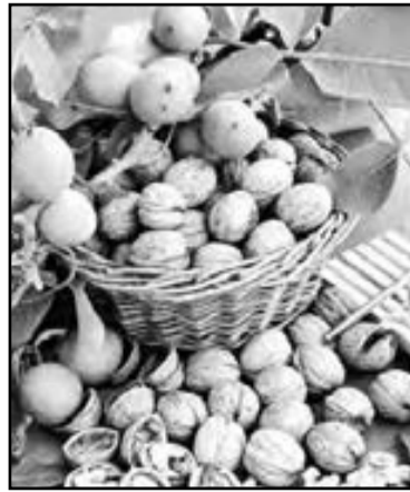
- Зрелые грецкие орехи по калорийности в два раза превышают белый хлеб: в 100 г ядер - 850 ккал.

- Незрелые грецкие орехи хорошо мариновать целиком, поскольку скорлупа еще мягкая. Для этого их опускают в уксус со специями, а после приготовления подают к мясным блюдам.