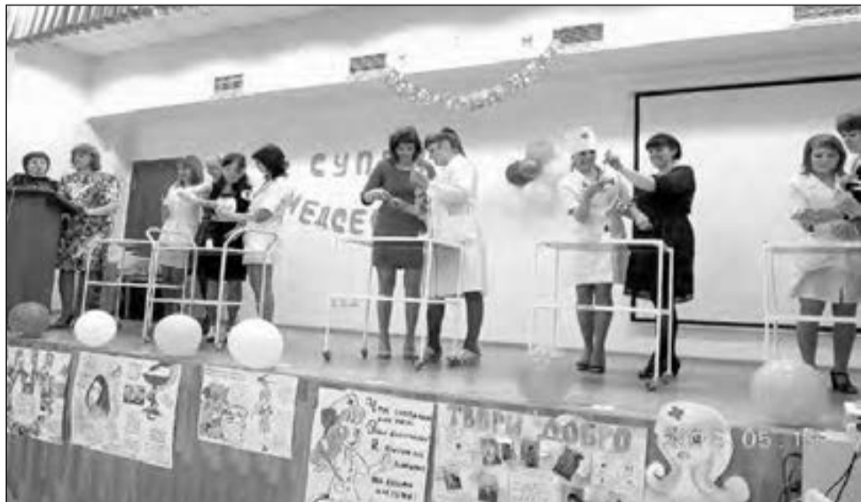
День медсестры, организованный профкомом, прошел весело, с настроением.