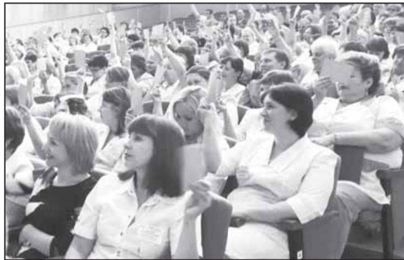
Идет отчетно-выборная конференция в областной клинической больнице.

Ход выполнения постановления VII пленума Омской облпрофорганизации работников здравоохранения РФ был рассмотрен на заседании президиума в конце первого полуго-