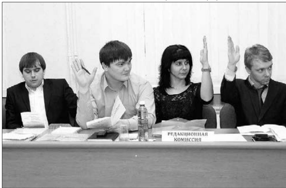
Учредительная конференция Совета молодых педагогов. 2014 год.