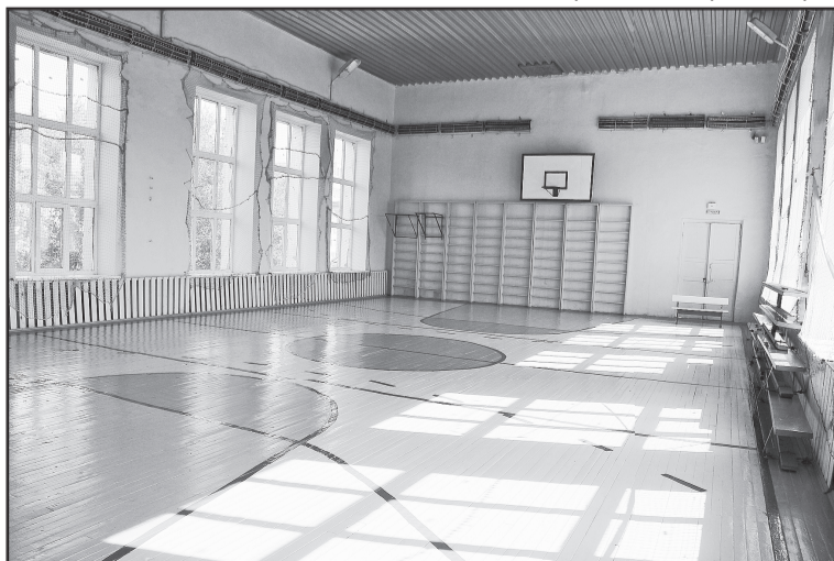
В школе № 91 Центрального округа всё готово к началу занятий.

вание было открыто, подрядчики наняты, ремонт идет полным ходом, так что можно надеяться, что