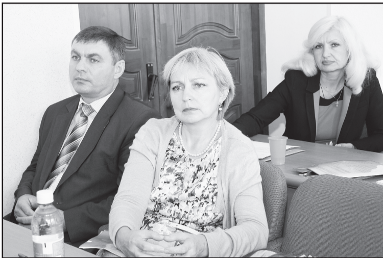
Профактиву было рекомендовано обратить особое внимание на совершенствование общественного контроля за охраной труда.

Пересмотру подверглось и составленное работодателем положение об оценке результативности труда и уровне компетен-