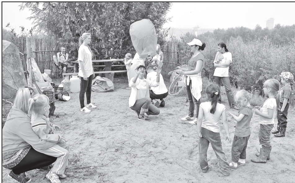
Спорт и активный образ жизни в «Омскгражданпроекте» любят все.

Соревнования развернулись сразу на нескольких спортплощадках. Команды состязались в волейбольном, футбольном турнирах, большое число участников собрала эстафета, состоящая из нескольких увлекательных и забавных конкурсов. Специальную развлекательную программу, включая бодиа-арт, придумали для детворы. Ребятам