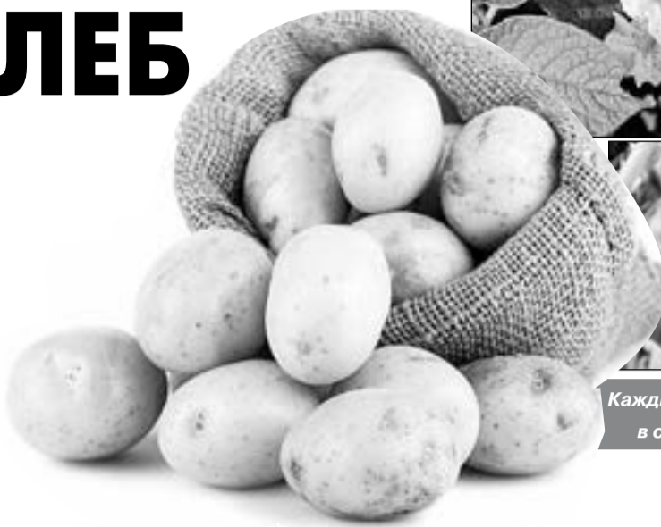
Каждый россиянин съедает за год в среднем 125 кг картошки.

245 лет назад, 26 августа 1770 года, русский ученый-агроном Андрей Болотов опубликовал первую научную статью о картофеле - «Примечания о картофеле», «о заведении, сажении и размножении картофеля», а также «о собирании и содержании оных». Это был один из первых шагов по распространению теперь всеми любимого овоща на Руси. Вообще история появления картофеля на столах и европейцев, и россиян довольно любопытна.