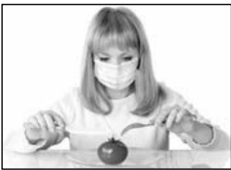
Согласно заключению Всемирной организации здравоохранения, безопасным считается количество 5 мг нитратов на один кг человеческого тела: то есть взрослый человек весом 70 кг может получать 350 мг нитратов в день без последствий для здоровья.

В процессе отваривания моркови и свеклы наиболее интенсивный переход нитратов в отвар происходит в первые 30-40 мин, далее процесс практически приостанавливается.