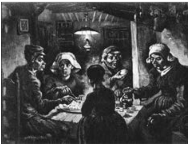
Едоки картофеля. Ван Гог, 1885 г.

Картофель является самой важной незерновой культурой в мире и занимает четвертое место по важности среди всех сельскохозяйственных культур, после кукурузы, пшеницы и риса.