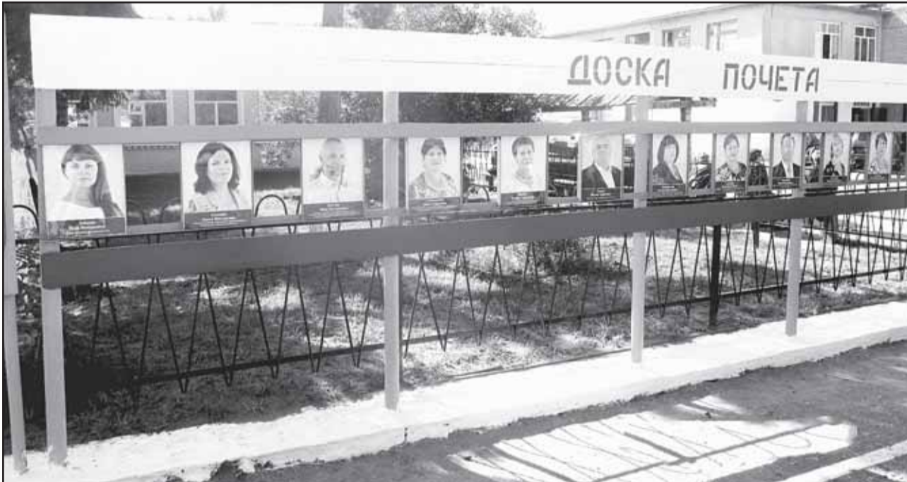
Открытие Доски почета было приурочено к 105-му дню рождения села.