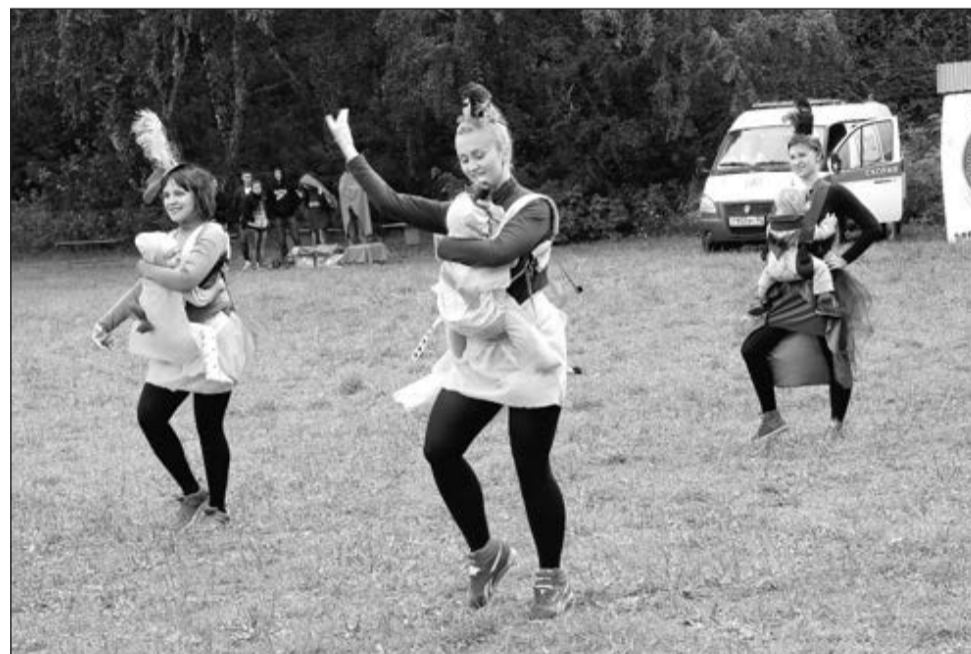
В качестве почетных гостей были на слете три представительницы студии семейного творчества «Слинголеди», исполнившие знойное танго со своими малышами в слингах.