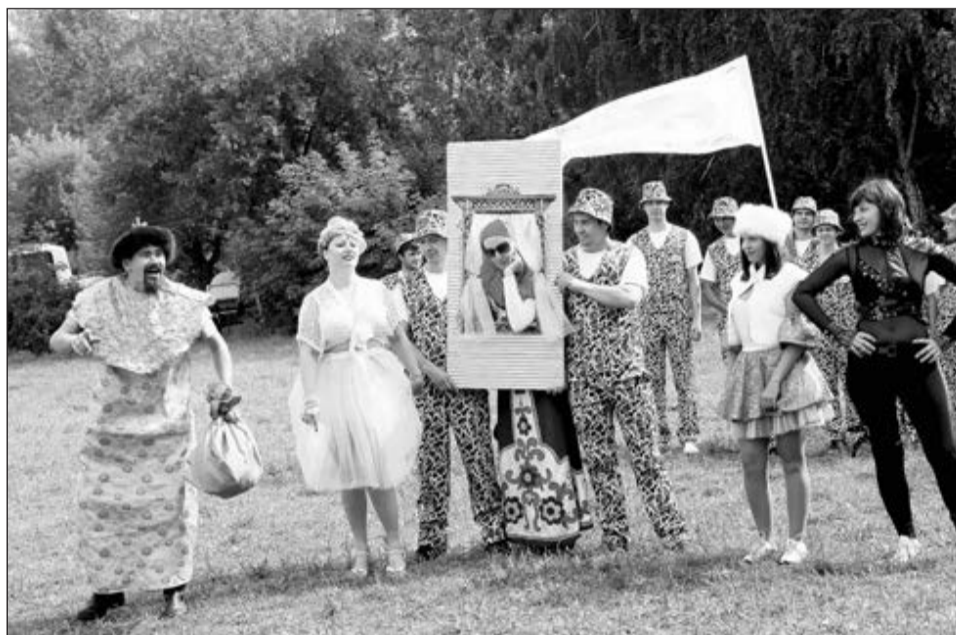
Команда «Электропрофсоюза» не первый раз среди призеров слета.

С танцем же приехали на слет в качестве почетных гостей и три представительницы студии семейного творчества «Слинголеди», исполнившие знойное танго со своими