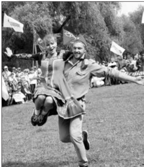
А железнодорожникам до призеров совсем немного - одна ступенька пьедестала.

Отметим и партнеров слета, сделавших всё возможное для того, чтобы он прошел