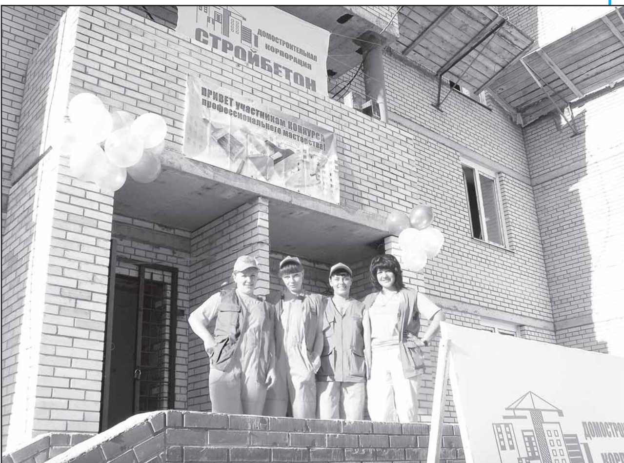
Соревнования в большинстве номинаций конкурса профмастерства строителей проходили на площадках "Стройбетона".

Многие вчерашние безликие окраины Омска сейчас трудно узнать. На их месте вырастают современные жилые массивы. В этом процессе преобразования одна из главных ролей принадлежит домостроительной корпорации "Стройбетон".