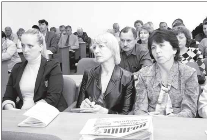
Собрание сторонников новой партии.

первички, и удивительно, как быстро положения этого документа находят отклик в сердцах и умах членов профсоюзов. Так что по поводу будущей численности отделения у меня беспокойства нет.