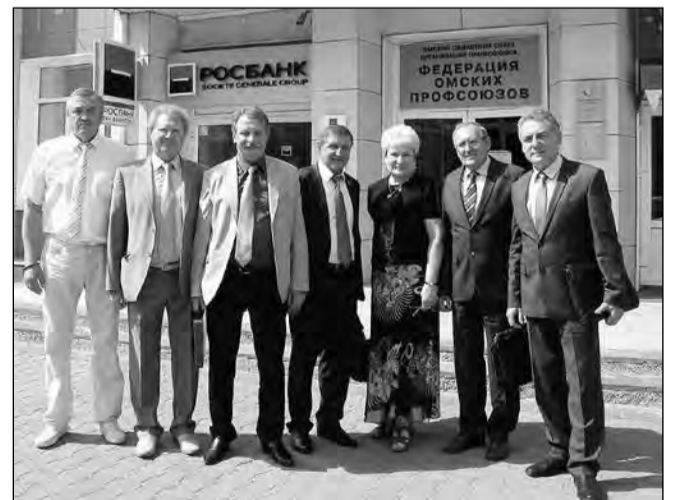
Представители Московской федерации профсоюзов с омскими коллегами.

Вместе с тем проблема обеспечения безопасных условий труда остается весьма актуальной, говорится далее в резолюции. В стране, по данным Росстата, ежегодно на рабочем месте погибают около 3 тысяч человек, 14 тысяч становятся инвалидами, 10 тысяч приобретают профессиональные заболевания.