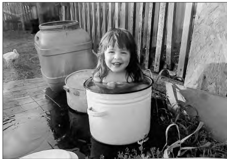
«Отдых после трудовых будней».