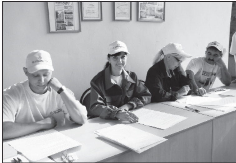
В знании теории машинисты мостовых кранов тоже оказались «на высоте».