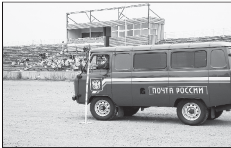
Препятствий на условной трассе немало, но и в повседневной работе водители сталкиваются с ними нередко.

дарки, а призеры стали обладателями дипломов и кубков.