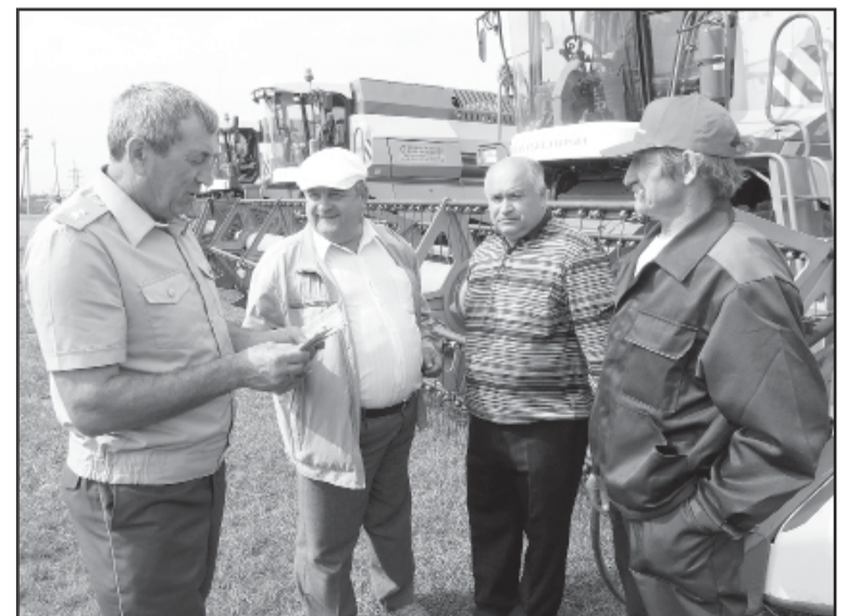
Нарушений не найдено, можно начинать уборку.