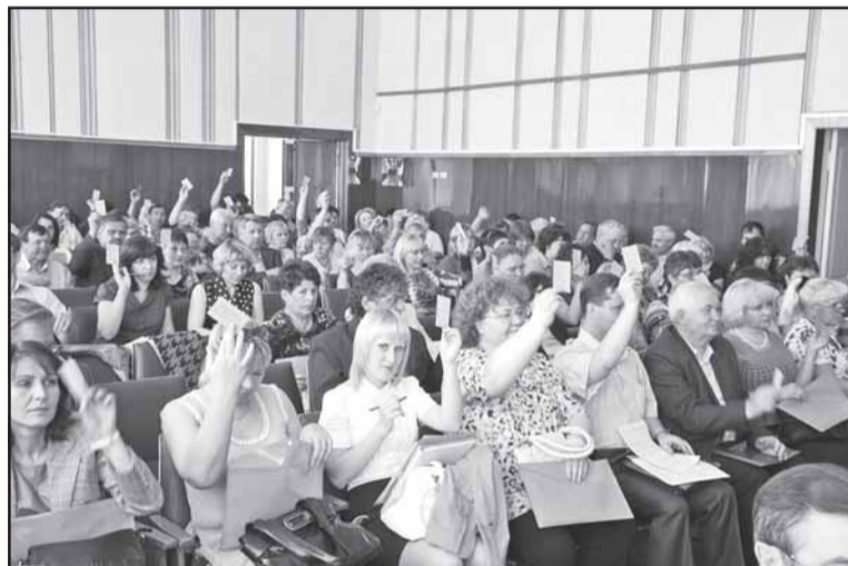
Делегаты единодушно дали положительную оценку работе профкома.

ного интернет-сайта профорганизации ПО "Полет", где можно получить сведения об уже проведенных и предстоящих профсоюзных мероприятиях, познакомиться с различными норматив-