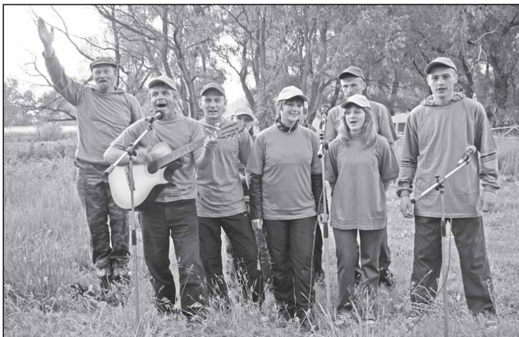
Победители конкурса туристской песни на турслете работников образования - команда Окешниковского района.