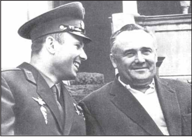
Юрий Гагарин и Сергей Королев.