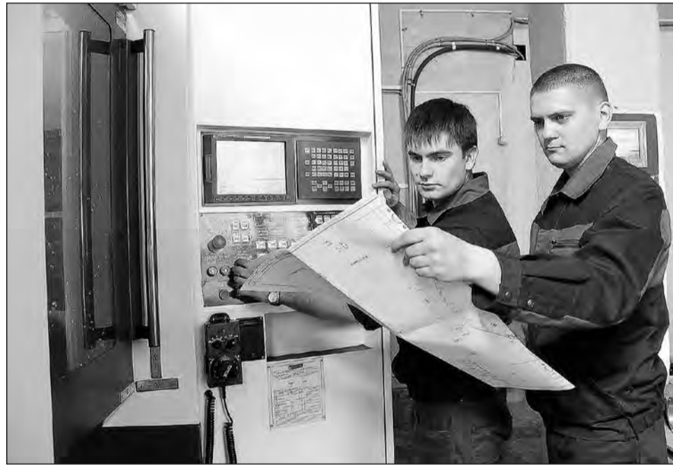
Парк оборудования на «Сатурне» пополняется самыми современными станками.

- Скажем, пока не знаю, как выстроить систему поощрения профсоюзного актива. Да, к праздникам - Новый год, 8 Марта и так далее - дарим подарки. Но хотелось бы и, например, путевку человеку вручить. Чтобы другие члены профорганизации видели: инициативность не останется незамеченной. А значит, появится дополнительный стимул для общественной работы в команде с такими людьми, как начальник участка свя-