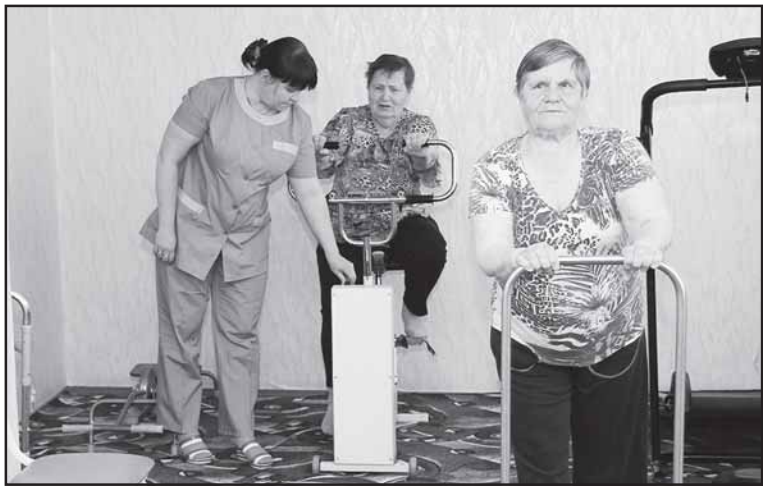
Регулярные занятия лечебной физкультурой помогают пенсионерам поддерживать хорошее самочувствие.

льевна Щербаква. - Кто-то действительно по стечению обстоятельств остается без родственников, без жилья. Но одиноки далеко не все. У многих есть дети и внуки. Бывает, люди приходят сюда по собственным убеждениям, вопреки протестам членов семьи - бабушки и дедушки, нуждающиеся в постоянном уходе, не желают их обременять. Кто-то считает, что здесь больше возможностей для общения и творчества. Некоторые родственники искренне беспокоятся о своих стариках, часто навещают. Но есть и такие, кто приходит исключительно в те дни, когда подопечным выплачивается пенсия... Безусловно, о нравственном аспекте рассуждать можно долго, но у социальных работников к проблеме свой подход: рядом с нами пожилые и инвалиды, которым нужны наша забота и внимание. Независимо от того, какие ситуации привели их сюда, мы должны помогать каждому из них. Здесь работать могут только люди особой породы, с большим сердцем и открытой душой. Проверкой для новых сотрудников обычно становится первый месяц-два. И если они в течение этого срока не ушли, испугавшись трудностей, не выдержав эмоционального напряжения, то, скорее всего, останутся надолго.