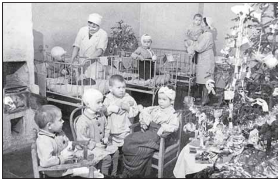
В хирургическом отделении Городской детской больницы имени доктора Раухфуса, Новый год 1941/42 г.

Бабушка стала слабеть, часто отдыхала. Спали одетыми вместе в одной кровати, она прижимала меня к себе, чтобы было теплее. Ночью во время бомбежек вставали