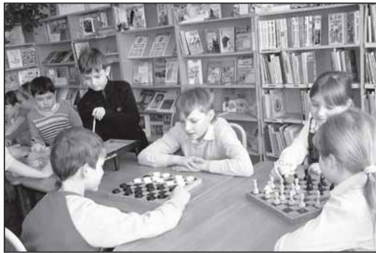
Культурный досуг в современной библиотеке - это не только чтение...

Для юных омичей тоже разработано немало творческих проектов. Один из них – «Тепло для маленького сердца» - адресован детям, находящимся на лечении в городских больницах. Работники библиотек выезжают в медучреждения с книгами и журналами, проводят мероприятия игрового характера. И вообще сегодня всё делается для того, чтобы между читателем и миром литературы было как можно меньше границ. Интересна в этом плане детская историческая библиотека «Отечество». Здесь нет привычных книгохранилищ, читальных залов и стойки абонемента. Вся литература на виду, и ее всегда можно взять домой. Еще одна «фишка» - чтение под открытым небом. С мая по сентябрь на площади перед зданием располагаются столы и стулья, и все же-