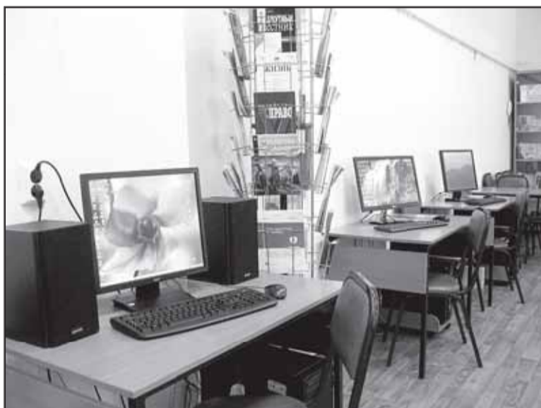
Практически все мероприятия в муниципальных библиотеках проводятся с использованием мультимедийных технологий.

В перспективе открытие семейных фотостудий - совместно с профессионалами мы будем обучать тонкостям художественной съемки и азам «Фотошопа».