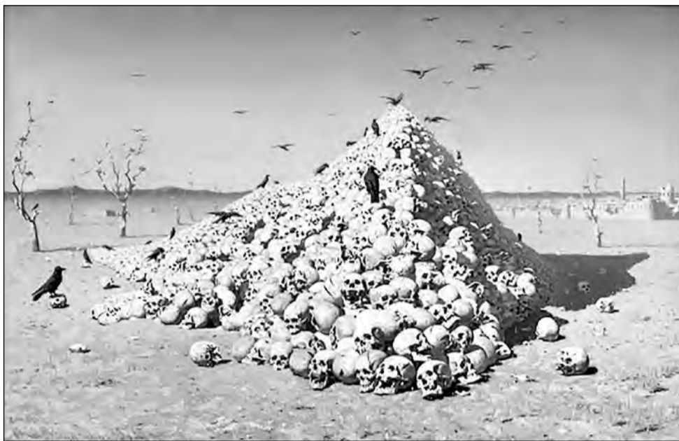
«Апофеоз войны», 1871 г.

Верещагин один из первых (а то и первый) в мире начал писать войну не как череду красивых подвигов, а во всей её суровой прозе. И в «Туркестанской серии» заговорил о