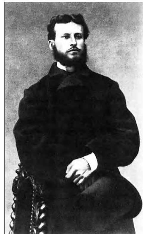
Василий Васильевич Верещагин (1842 - 1904) - русский живописец и литератор, один из наиболее известных художников-баталлистов.

Здесь переплелись два сюжета, причём каждый по-своему подсказывает, откуда возникла у художника идея картины. Тимур (Тамерлан) действительно устрасал побеждён-