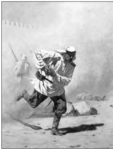
«Смертельно раненный», 1873 г.

цене побед – вспомните такие вещи, как «Забывтый», «Смертельно раненный», «Окружили – преследуют». (Хотя, заметим, Кауфман, увидев «Забывтого» на выставке, обиделся. Там был изображён брошенный в пустыне убитый русский солдат, и генерал вспыхнул: ложь, я не оставлял непогребённым ни одного павшего! Заставил художника прилюдно сказать, что данное полотно – «художественный вымысел». Позже расстроенный Верещагин эту и ещё две «острые» картины сжёг –