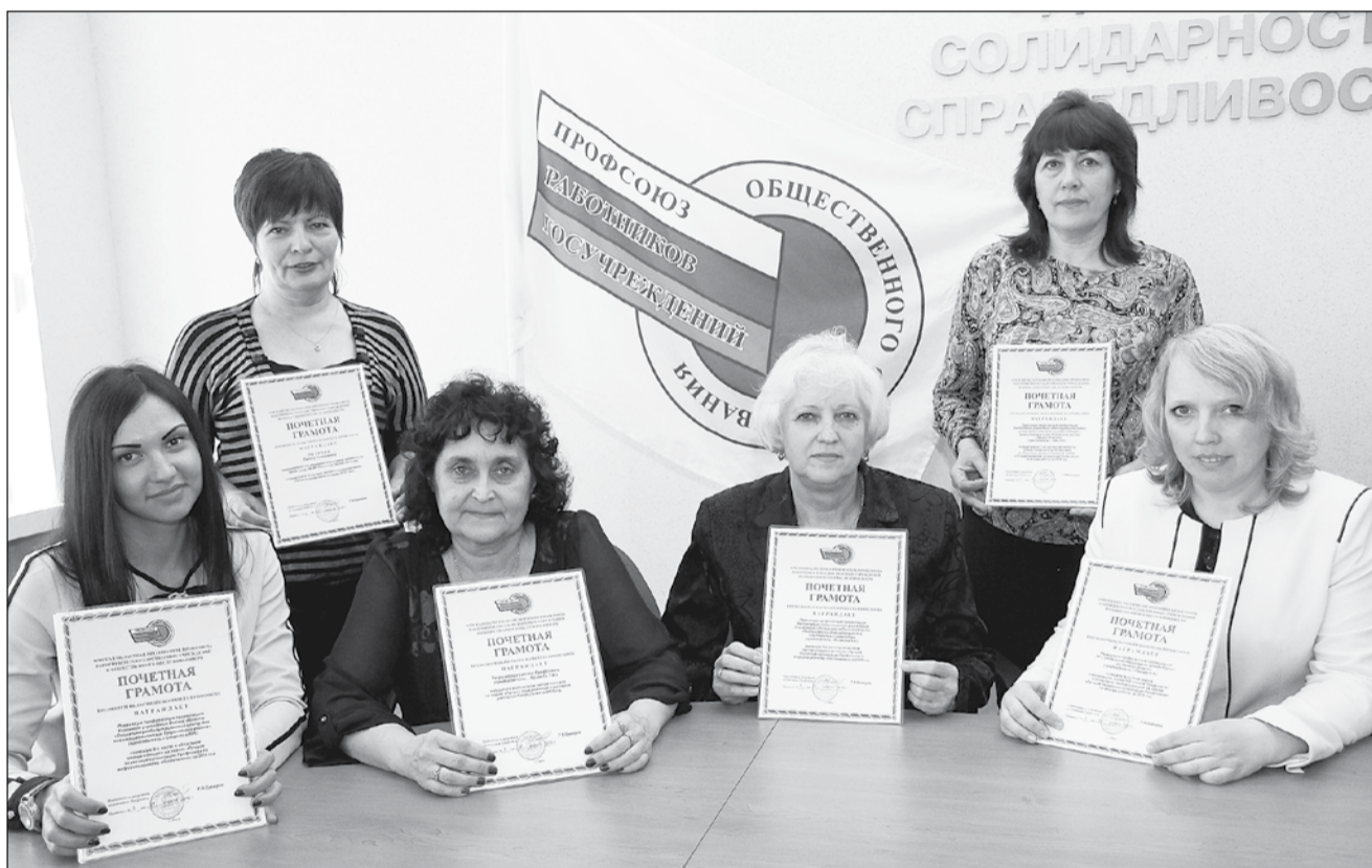
Лучшие профсоюзные активисты облпрофорганизации работников госучреждений и общественного обслуживания.

Омский обком профсоюза работников государственных учреждений и общественного обслуживания подвел итоги традиционных конкурсов за 2015 год.