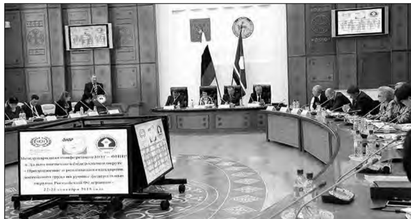
Группа технической поддержки по вопросам достойного труда и Бюро МОТ для стран Восточной Европы и Центральной Азии представила концепцию того, как должен выглядеть труд в XXI веке.

Международная организация труда (МОТ) строится на принципе её Устава, который гласит, что всеобщий и прочный мир может быть установлен только на основе социальной справедливости. МОТ внесла непосредственный вклад в такие достижения индустриального общества, как восьмичасовой рабочий день, охрана материнства, законодательство по детскому труду, а также ряд положений о безопасности труда и мирных трудовых отношениях. Организация является международным учреждением, дающим возможность работать над подобными проблемами, находить их решение и в конечном итоге улучшать условия труда повсюду в мире. Ни одна страна или отрасль промышленности не смогла бы добиваться этого без подобных же одновременных шагов со стороны своих конкурентов.