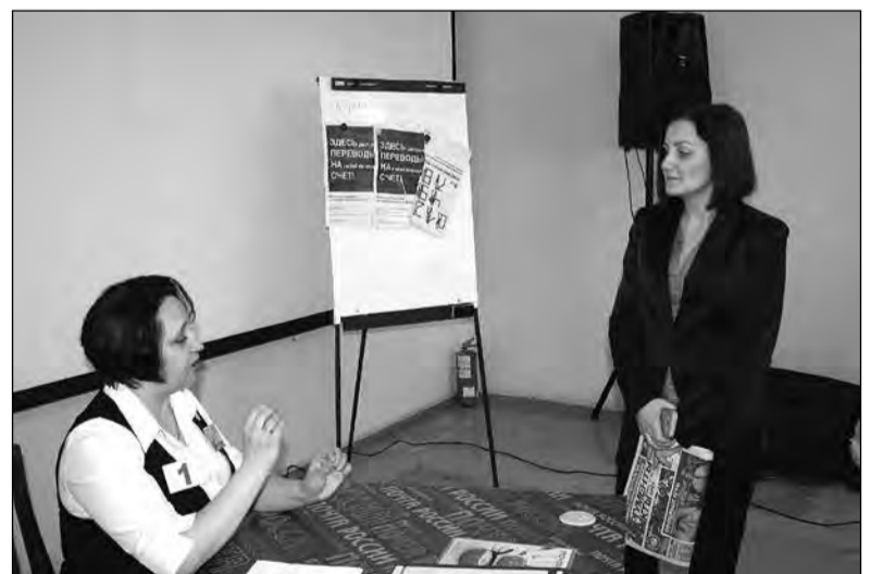
Во время практического задания голова у участниц шла кругом: надо одновременно контролировать обстановку в отделении и решать проблемы капризных клиентов.