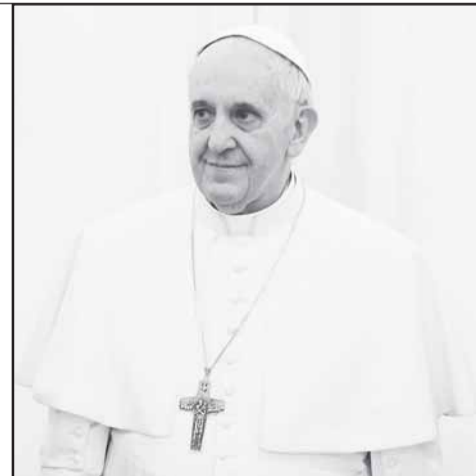
266-й папа римский Франциск.

4 достоверных случая отречения пап от престола до Бенедикта XVI. 598 лет назад произошло последнее перед Бенедиктом XVI отречение папы — Григория XII. 5 пап в «Божественной комедии» Данте помещены в ад. В том числе Целестин V — за отречение. 1006 дней пустовал Святой престол после смерти Климента IV до избрания Григория X, состоявшегося в 1271 году. Это были самые долгие выборы папы. В 1274-м для ускорения этого процесса были приняты новые жесткие правила. 3 дня кардиналы, запертые для избрания папы в особом помещении, получали полноценное питание. Затем их рацион ограничивали одним блюдом в день. Если на восьмой день они не приходили к согласию, их переводили на хлеб и воду до принятия решения. 120 кардиналов (не более) могут участвовать в выборах папы. Так было решено в 1975 году.