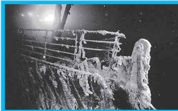
"Титаник" ржавеет на глубине 3750 метров, разбросав обломки на двух с лишним квадратных километрах.