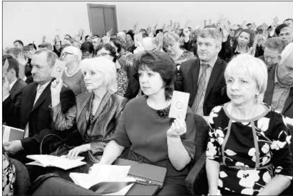
На конференцию собрались 118 делегатов, представляющих более чем 236 тысяч членов профсоюзов области.

пределения путевок. Таков круг проблем, которые требуют внимания отраслевых профорганов и Федерации в ближайшее время.