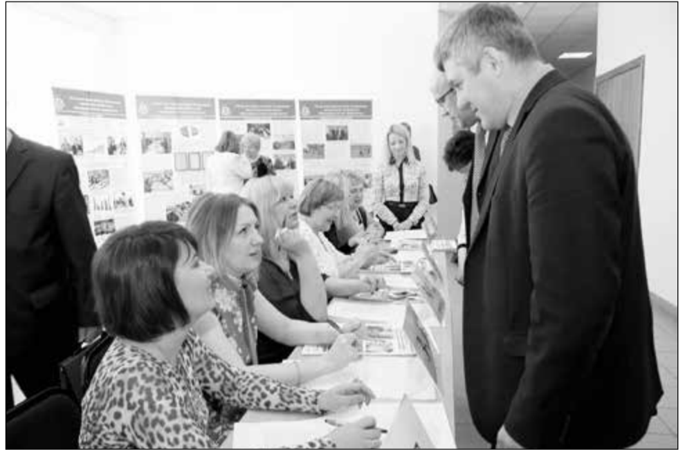
Идет регистрация делегатов конференции.

Беспокоит нехватка возможностей для полноценного оздоровления педагогов. За счет средств облбюджета каждый год в профилактории «Оптимист» поправляют здоровье 1250 работников отрасли, но это крайне мало, если учесть, что в учреждениях образования области, где есть профорганизации, трудится почти 55 тысяч человек. Обострилось и положение дел с детским летним оздоровлением, есть претензии к системе рас-