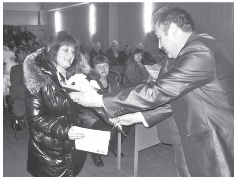
Денежные премии, цветы, поздравления получили 79 рабочих и специалистов СПК "Большевик".

крестьянского труда этот праздник наверняка запомнится надолго. Хорошо, что руководство и профком "Большевика" твердо намерены и впредь поддерживать и развивать добрую традицию чествования работников за их добросовестный и