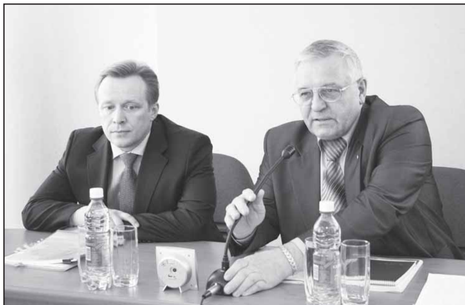
Министр экономики Омской области Игорь Мураев и председатель ТОО "ФОП" Валерий Якубович: разговор по существу и с пользой для дела.

ной капитал составил 110 процентов к уровню 2010 года, что значительно выше показателя по России. Введено 76 объектов промышленного и сельскохозяйственного назначения, что наряду с реализацией специальных программ способствовало снижению напряженности на рынке труда: на одну вакансию приходился один незанятый омич. Уровень зарегистрированной безработицы снизился до 1,3 (в 2010 году - 1,7). В результате роста производства увеличились денежные доходы населения. По данным Минэкономики, заработная плата возросла почти на 14 процентов.