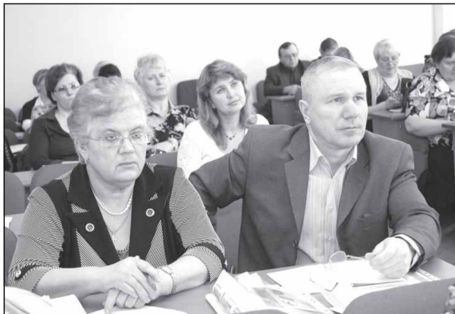
На пленуме председатели районных профорганизаций имели возможность задать волнующие их вопросы представителям сторон соцпартнерства.

Елена ГЕНЕРАЛОВА.