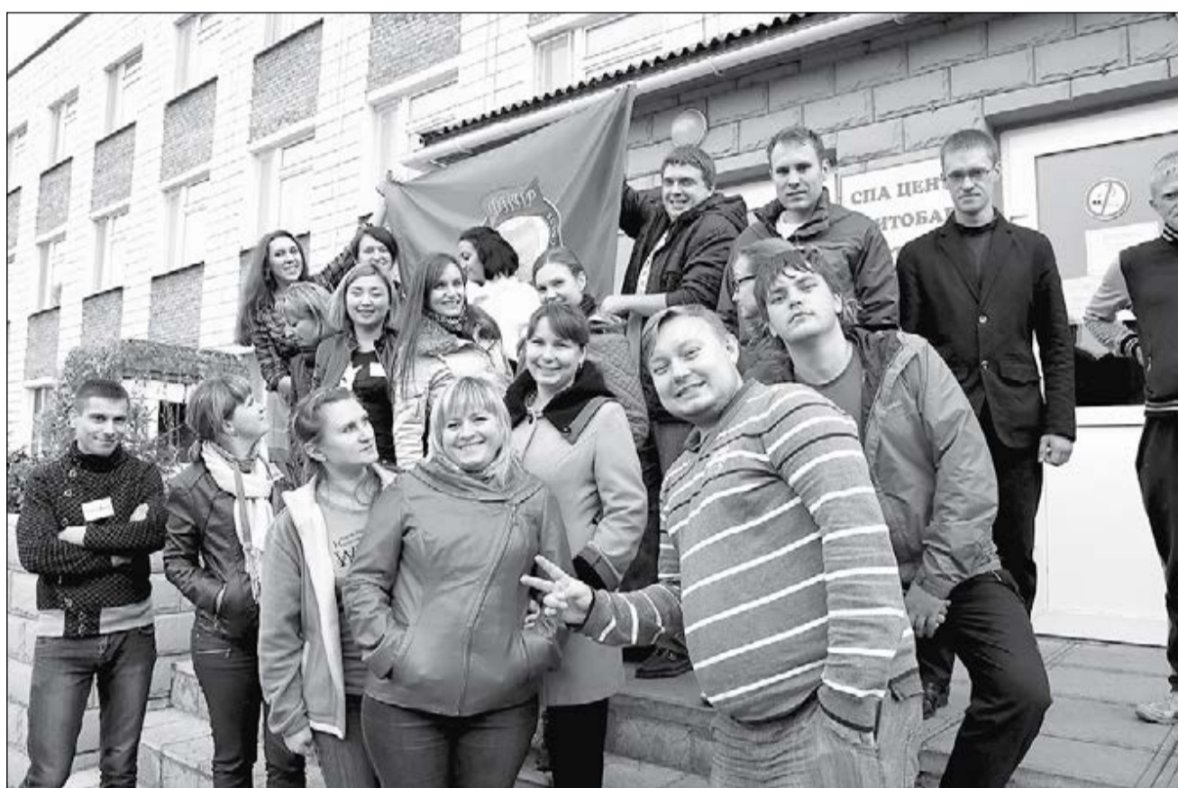
По признанию самих ребят, школа молодого лидера открывает новые возможности, направления, которые можно самим выбирать и смело по ним шагать.