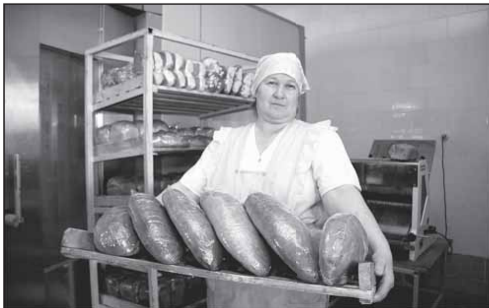
Охрана труда - сфера, где особенно тесно взаимодействуют администрация и профком СПК «Ермак». За последнее время здесь улучшены условия труда на многих производственных объектах, в числе которых и местная пекарня, радующая жителей хозяйства вкусным ароматным хлебом.