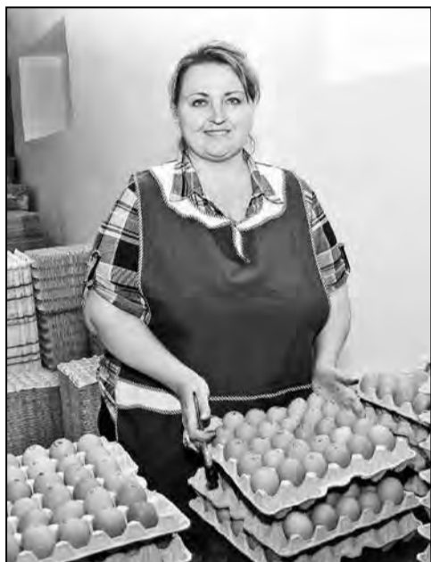
Любинская птицефабрика реконструируется и набирает объёмы производства яиц.