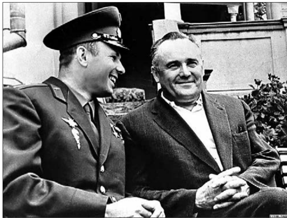
Юрий Гагарин и Сергей Королёв.

В полёте Юрий Гагарин поддерживал связь с научно-измерительными пунктами полигона Тюра-Там (позывной «Заря-