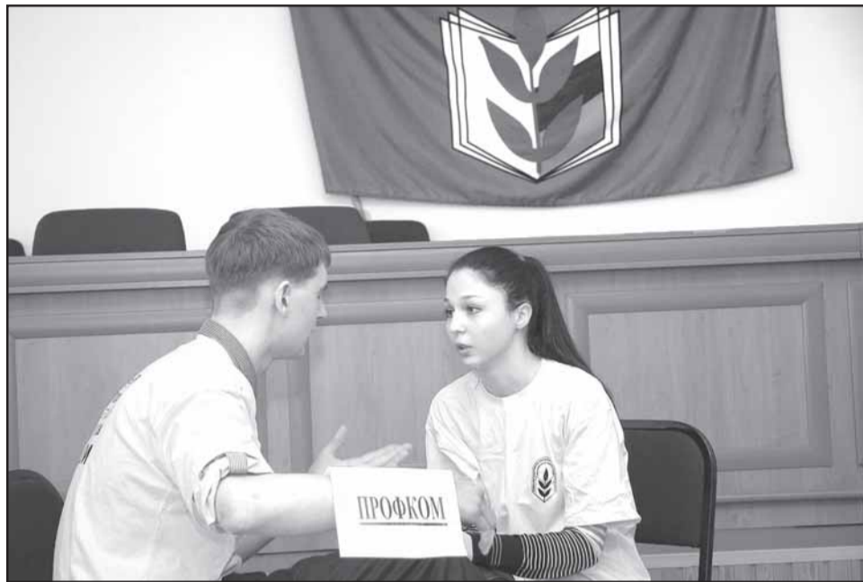
Самые убедительные доводы в пользу профчленства нашла команда СибАДИ.

Следующим этапом конкурса стали музыкальные выступления агитбригад на тему мотивации профчленства. Проблема эта весьма актуальна для студенческих первичек, состав которых год от года обновляется. В полной мере продемонстрировать многообразие способов мотивации, безусловно, получилось у агитбригады СибАДИ. Главным героем сценки, представленной этой командой, был первокурсник, которому за один день удалось узнать обо всех преимуществах профчленства. Для начала новоиспеченному студенту профком помог получить комнату в общежитии и выделил матпомощь. Кстати, обеспечению "жильем" предшествовали переговоры с "администрацией", которые профактив провел весьма грамотно и дипломатично. А дальше новичка ждали экскурсия по вузу и знакомство с различными формами досуга студентов, организуемыми профкомом. Наиболее увлекательным, пожалуй, был рассказ о путешествиях во время каникул. Сочи, Алтай, Шерегеш... - такие маршруты уже пройде-