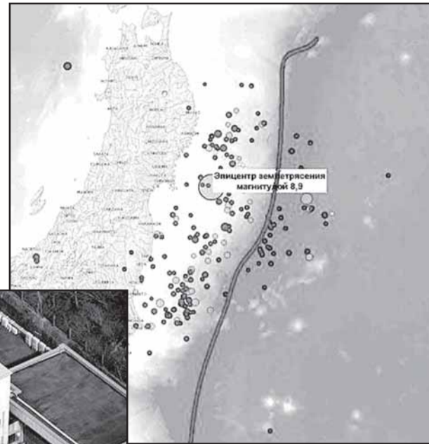
Подземные толчки на карте; линией примерно показано расположение Японского желоба.

Действительно, сейсмографы в Японии зафиксировали первичные толчки и моментально рассчитали местоположение эпицентра. У системы заняло около десяти секунд на то, чтобы оценить опасность надвигающегося