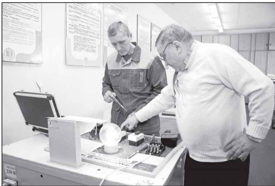
Результат работы конкурсантов-электромонтеров - свет лампочки: дефекты в электросхеме устранены.

А дальше всё, о чем было заявлено в "визитках", нужно было показать на деле. Конкурсанты сменили арену битвы и приступили к выполнению практических заданий. И если на сцене некоторые всё же испытывали робость, то за привычной работой от нее не осталось и следа. Здесь каждый явно был в своей стихии. Уверенность чувствовалась в каждом движении. Задания участникам предлагались не надуман-