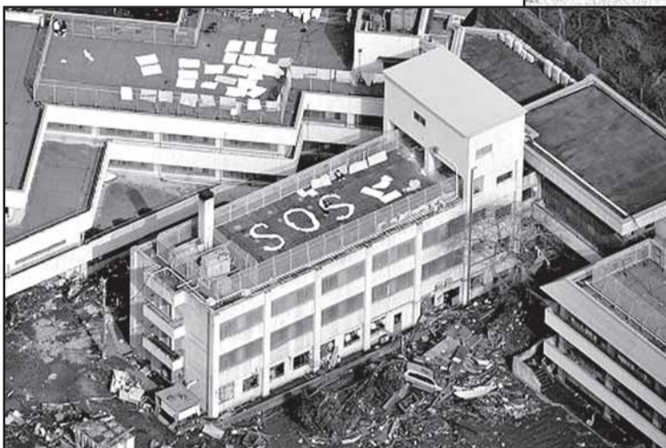
В ожидании помощи.

Что является первопричиной на самом деле, сказать сегодня невозможно, но землетрясение приобрело действительно глобальный масштаб. В результате произошедшего перераспределения масс произошло смещение оси вращения Земли – точнее го-