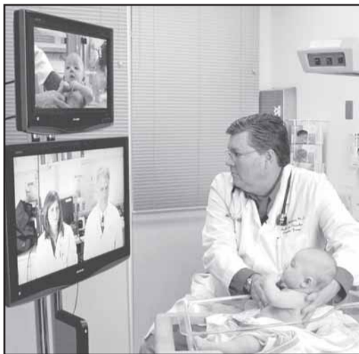
На модернизацию регионального здравоохранения будет выделено более 7 млрд рублей.

Озвучены и такие цифры: для государственных и муниципальных медучреждений области предусмотрен софинансированный бюджет в размере 420 млн