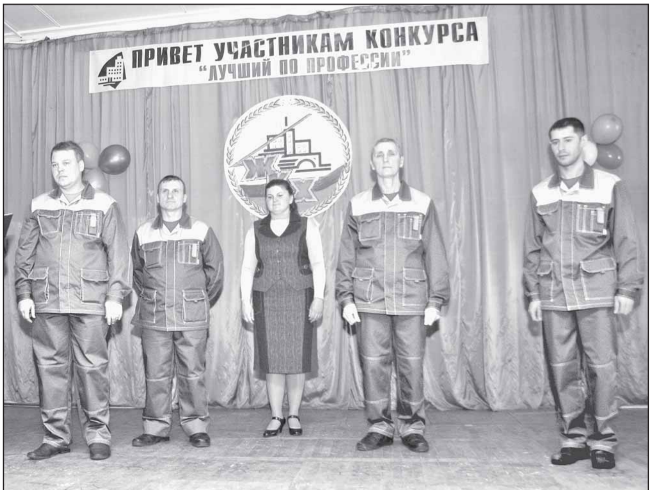
Команде ООО "Весна-1" и "Космос-1" конкурс принес сразу три победы: из пятерых участников трое признаны лучшими по профессии.

Подписаться на «Позицию» можно в любом отделении связи. ИНДЕКС ПОДПИСКИ 53022.