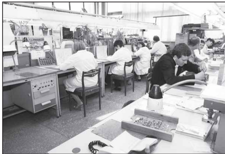
Сборочно-монтажный участок № 2.

ОАО "Сатурн" сейчас входит в состав концерна ПВО "Алмаз-Антей". Так вот политика здесь та же - надо омолаживать персонал. Для наиболее способных начинающих специалистов есть именные стипендии, на которые, конечно же, могут претендовать и омичи. Боль-