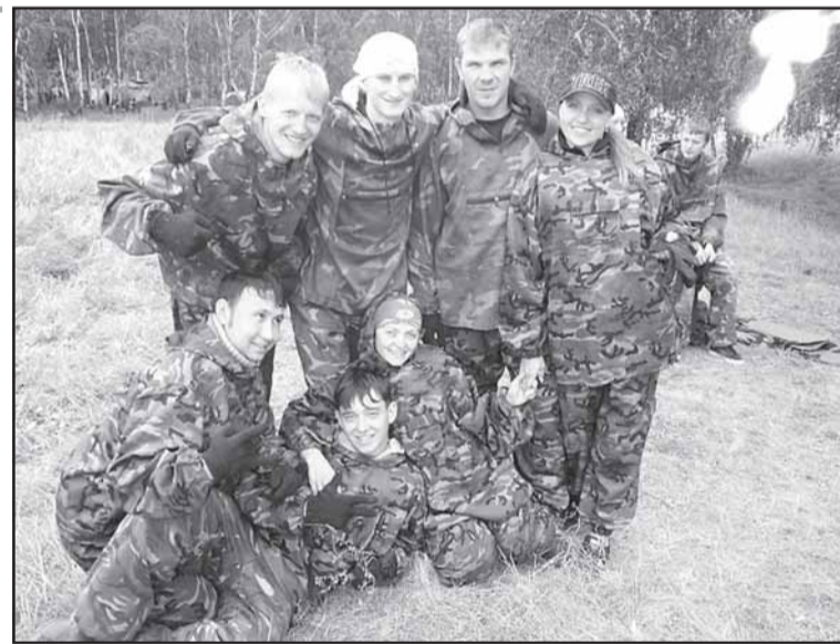
Команда ОАО "Сатурн" на VI туристическом слете предприятий и организаций, проводимом ТОО "ФОП".

В общем, с первых дней на заводе работник явно ощущает, что он не просто выполняет ту или иную технологическую операцию, получая за это денежный эквивалент, - он участвует в решении общих задач, в выполнении программы развития предприятия. Кстати, после завершения программы, рассчитанной до 2012 года, в акционерном обществе уже приняли