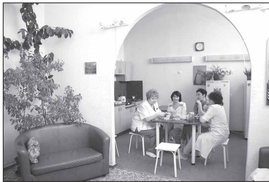
Общая забота администрации и профкома БСМП-1 - создание комфортных условий для работы и отдыха сотрудников.

Все первичные организации, занявшие призовые места (а они названы выше), имеют профчленство близкое к стопроцентному, постоянно занимаются обучением своего актива (собственные школы профактива функционируют в МУЗ "БСМП-1", БУЗОО "Медицинский колледж"), участвуют в областных