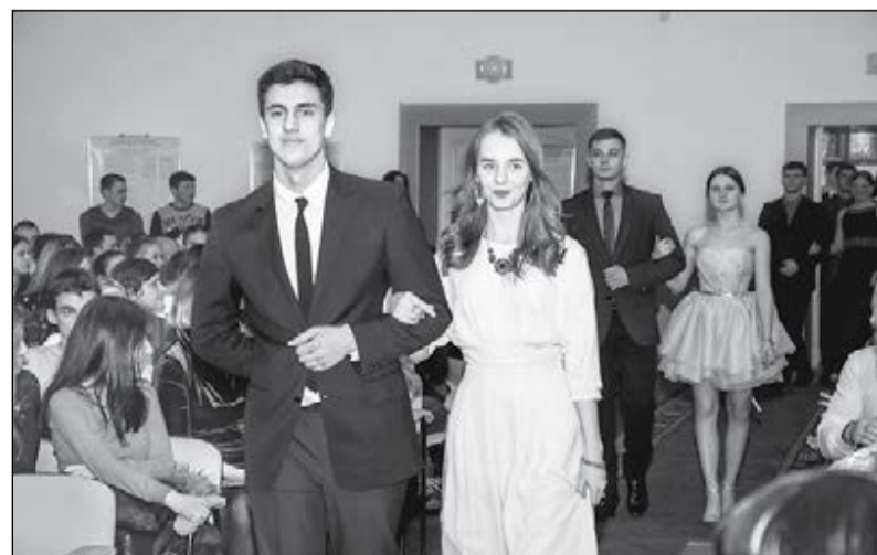
Болельщики приветливо встречали участников конкурса.