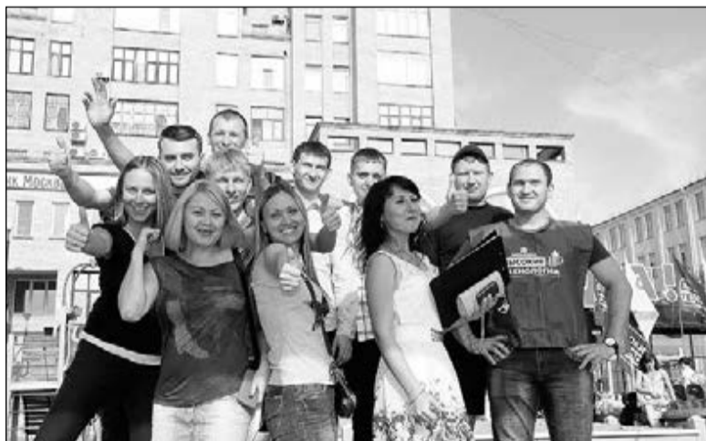
Вместе любые дела по плечу.