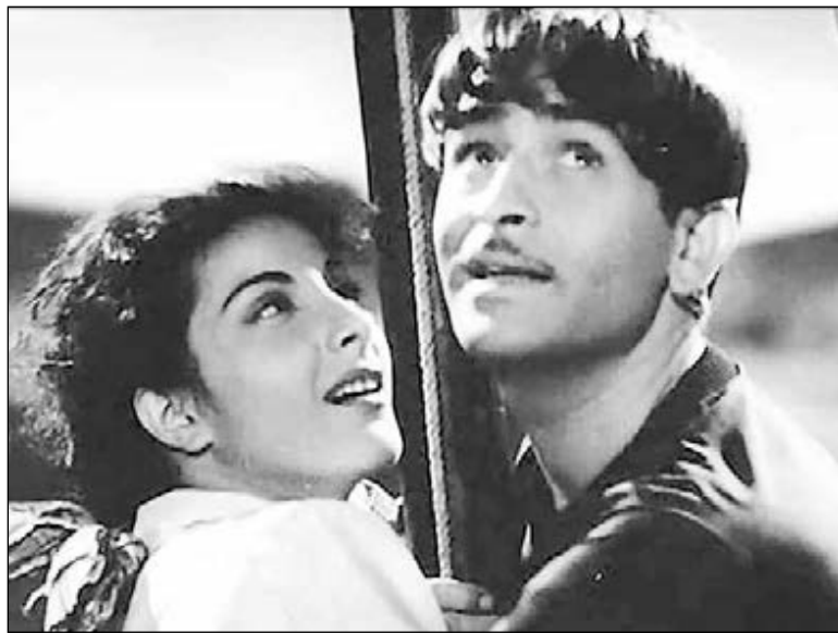
Эту пару на экране зрители воспринимали как супружескую — их роман за кадром трудно было скрыть. Когда же Наргис вышла замуж, переживал не только Радж, но и многомиллионные толпы поклонников «сладкой парочки».

Это проявилось уже в «Сангаме» — первом в его карьере цветном фильме, снятом в 1964 году. Правда, сам Радж изменений не замечал — он был слишком занят. Со дня основания «Радж Капур филмс»