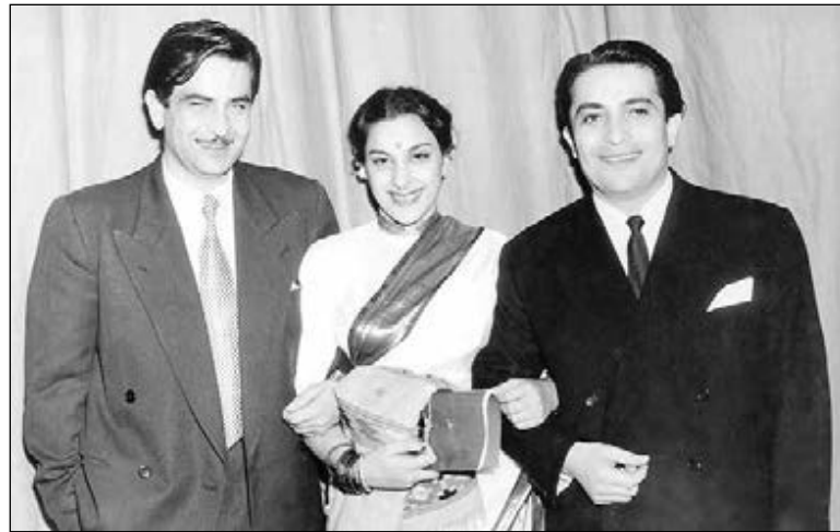
Радж Капур, Наргис, Рашид Бейбутов. В 1954 году актер впервые попал в СССР, и эта поездка, вспоминал он, стала для него открытием: «В Советском Союзе мощная киноиндустрия, но поразило меня не это, а люди — приветливость и любовь миллионов людей».

Но постепенно и до него стало доходить, что времена изменились — его фильмы, его герои перестали