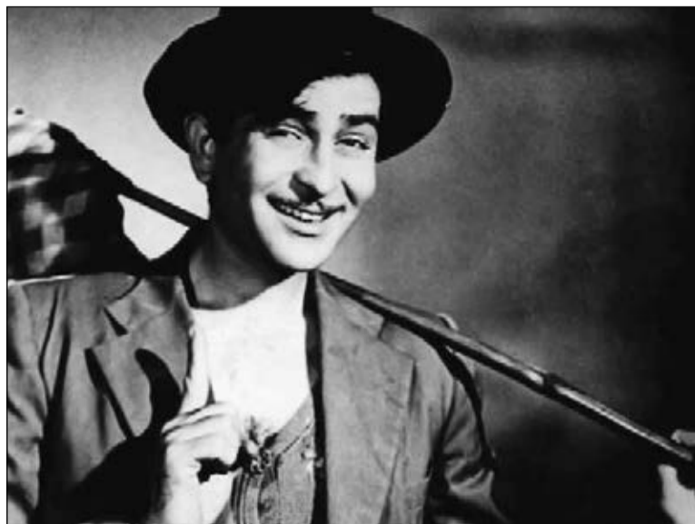
Кадр из фильма «Бродяга». Когда в 1955 году советские зрители штурмовали кинотеатры, чтобы посмотреть фильм «Бродяга», руководителям Госкино пришлось закупить и «Господина 420». Так началась волна небывалой популярности индийских фильмов в СССР.

Самой знаменитой ролью Раджа стал бродяга из одноименного фильма. Таких бродяг он во множестве видел на улицах Бомбея, куда отец перевез семью из захолустного Пешавара, Бомбея — самого многолюдного города Индии, где рядом с помпезными особняками английских чиновников стояли жалкие лачуги, в которых в грязи и тесноте ютились сотни тысяч обездоленных. А рядом с одетыми в костюмы и галстуки клерками полуобнаженные факиры показывали свои чудеса. Первая попытка снять здесь кино провалилась — индийцы отказались предстать перед камерой, уверенные, что она вытянет из них душу, чтобы вдохнуть ее в изображение на пленке.