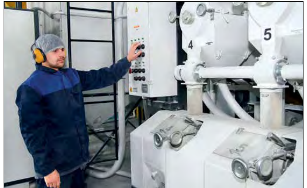
В хозяйстве строго следят за исправностью оборудования.

Еще разительнее цифры бухгалтерских ведомостей: балансовая прибыль в 2014-2015 годах составляла 54 миллиона рублей, а в 2016-м выросла до 73 миллионов, рентабельность хозяйства в 2016 году по сравнению с предыдущим годом увеличилась на пять процентов - до 29 процентов. И вот что немаловаж-