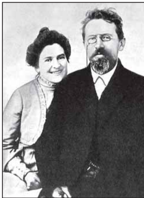
А. Чехов с женой О. Книппер.

В 1876 году Чеховы разорились, продали лавку и переехали в Москву. Антон Павлович остался в Таганроге заканчивать гимназию. Отец не мог помогать юному Антоше, так