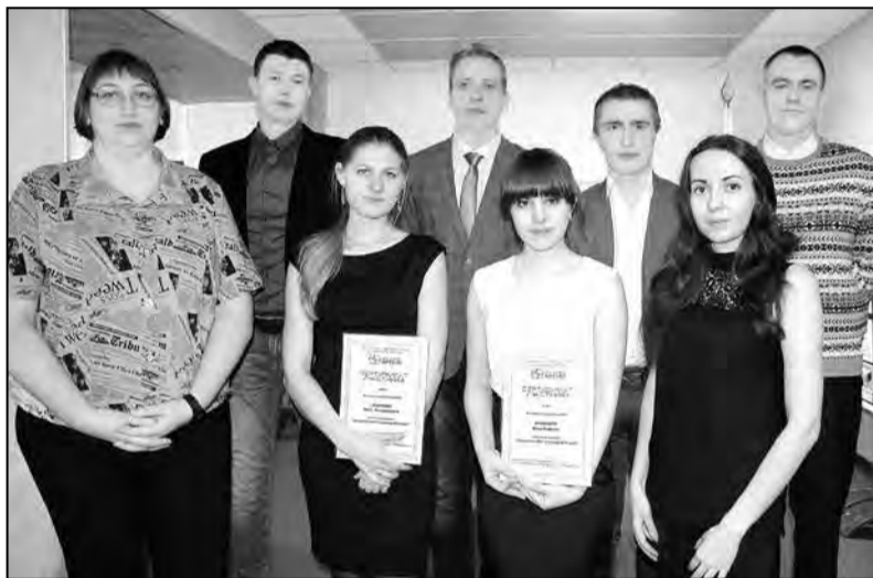
Участники и победители конкурса.