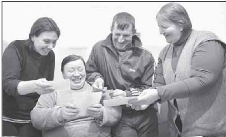
Работникам ООО «Еремеевское» есть что вспомнить, рассматривая фотографии, сделанные на базе отдыха.