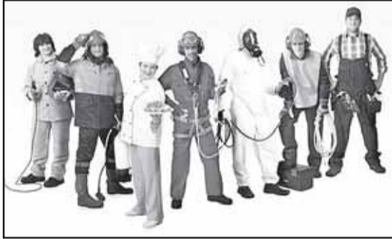
взносов в размере 60% от размеров тарифов на обязательный соцстрах от несчастных случаев на производстве и профзаболеваний.

При этом сохраняются 32 страховых тарифа (от 0,2% до 8,5% к начисленной оплате труда по доходу застрахованных лиц). Эти тарифы дифференцированы по видам экономической деятельности в зависимости от класса профессионального риска. (Правительство вновь не представило вместе с документом проект соответствующего классификатора - каждый год он обнародуется позже принятия закона о тарифах.) Планируется также продлить предоставление организациям инвалидов льгот по уплате страховых